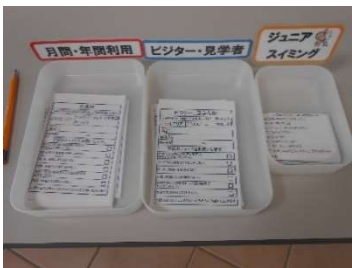
● 利用者別記名式体調確認用紙