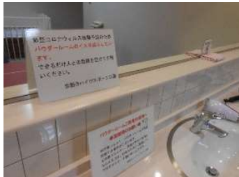
●脱衣場の洗面所の告知