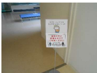
●ギャラリー入り口の告知