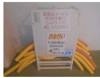
● 使用後用具の洗い流しをお願い②