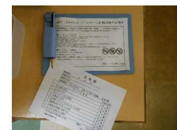
●屋外施設利用者への予防対策啓蒙