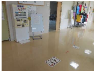
● ソーシャルディスタンスの告知