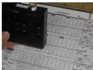
● プール水、湯風呂の水質管理徹底