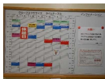
● トレーニングジム利用者向け啓蒙