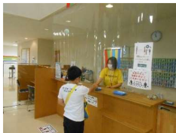
● 飛沫防止シートの設置