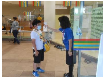
● 入館前の検温の徹底