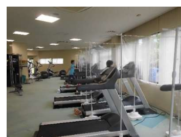
● ランニングマシンの飛沫防止

これら対策を館内利用者に解り易く啓蒙することに加えホームページでは随時入館時の注意及び案内を掲示し感染予防対策の徹底を行っています。