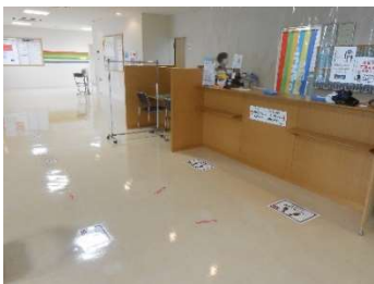
● 館内の距離の取り方を告知