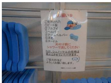
● 使用後用具の洗い流しをお願い①