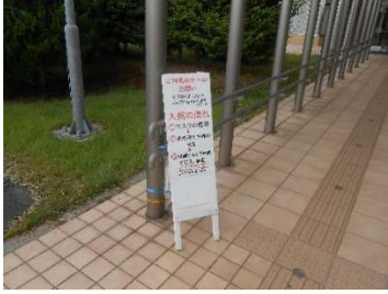
● 玄関前に入館制限を告知