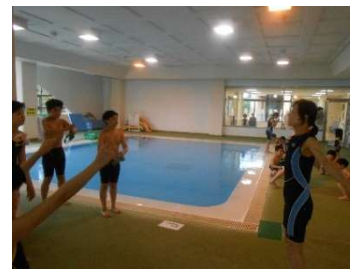
● プールマスク着用で水泳指導