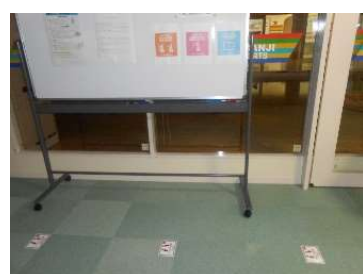
● スタジオ前の啓蒙