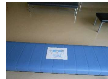
●ギャラリーのイス