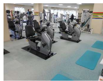
● マシンの配置工夫