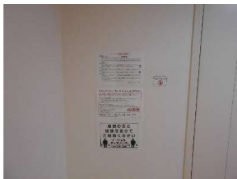
●ロッカールーム入口にも啓蒙