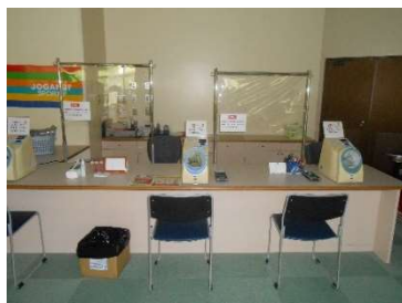
● カウンセリングエリア