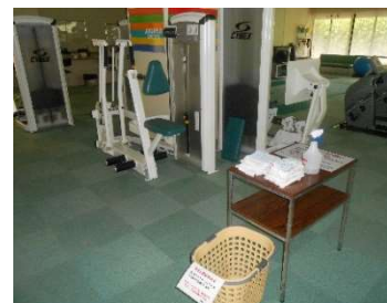
● 器具使用後の消毒剤設置