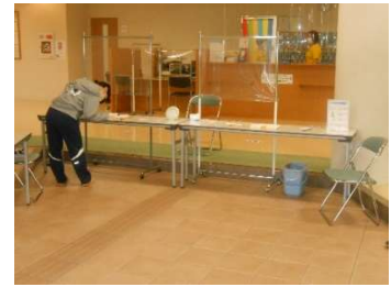
● 入館時の記名式体調確認の実施