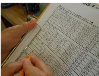
●従業員の消毒作業チェック表