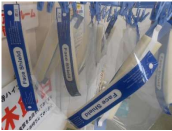
● 従業員全員のフェイスシールド