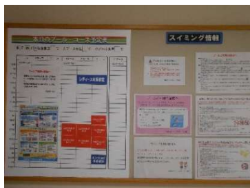
● プール利用者向け掲示板で啓蒙