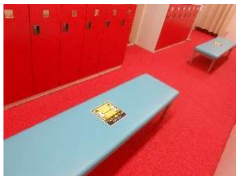
●ロッカールームのイスに告知