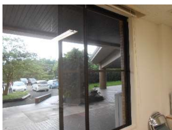
●全館の窓に網戸を設置し換気