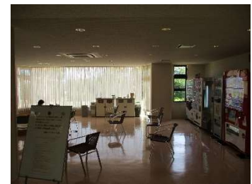
● ラウンジの利用制限